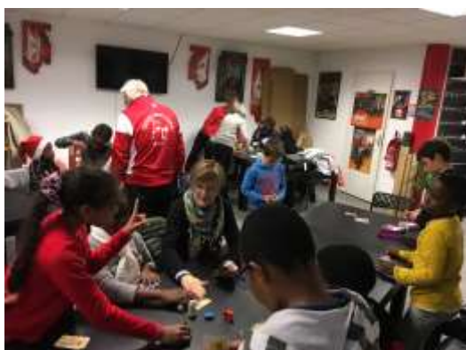
Sortie à l'Arche à jeux

Bonus : Lorsqu'il y a trop de bénévoles présents un soir ou que les devoirs sont terminés tôt, certains d'entre eux proposent des ateliers de jeux de société, de dames, d'échecs et de golf.