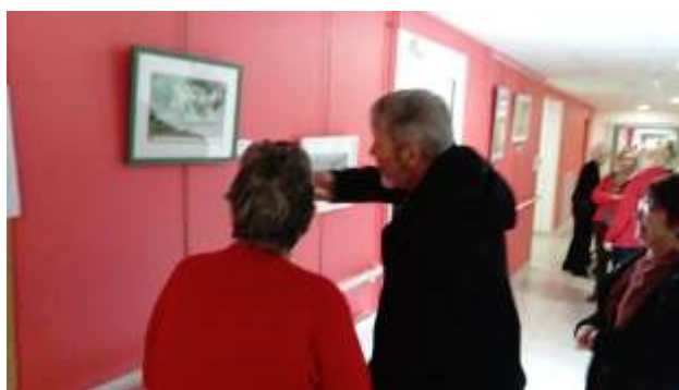
L'atelier Peinture Plaisir en Liberté remet ça ! Ici à l'EHPAD de Kerlevenez en mai 2019

« Favoriser le travail en partenariat avec d'autres structures et l'organisation d'actions innovantes. » Extrait du Projet Associatif