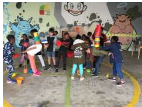
Jeux du J'accumule

Evènements : Le jeudi avant les vacances nous essayons d'organiser une sortie (pas toujours possible). Nous sommes allés faire des jeux de société à l'Arche à jeux, avons participé au Cool Bus avec La Carène et une sortie est prévue pour le dernier jeudi de l'année (pas encore déterminée car dépend des envies des enfants).