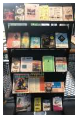
Les meubles flyers