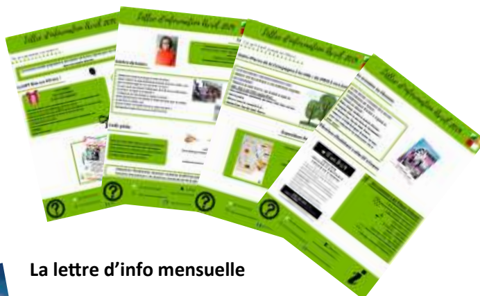
La lettre d'info mensuelle

« Pour développer et valoriser son activité, la MPT doit utiliser tous les supports médias et multimédias à sa disposition.[...] Donner à voir les réalisations de ses adhérents afin de les valoriser. » Extrait du Projet Associatif