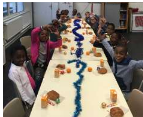
Goûter de Noël