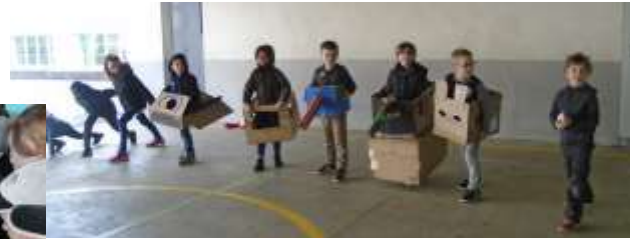
Caisses à savon