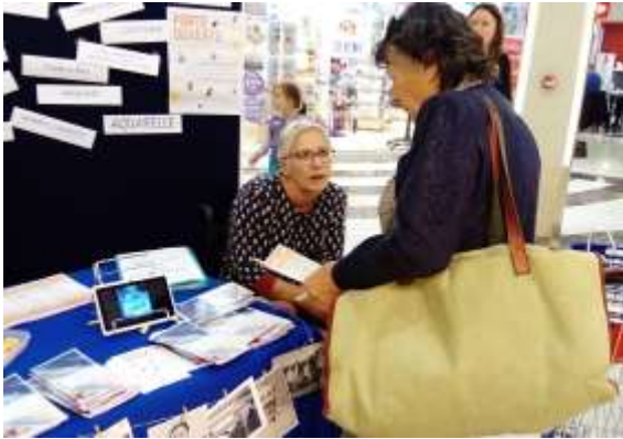
Carrefour des sports—350 tracts de distribués

Portes ouvertes à la MPT—85 inscriptions 25 séances d'essais