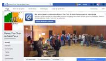
Facebook : Maison Pour Tous de Saint-Pierre