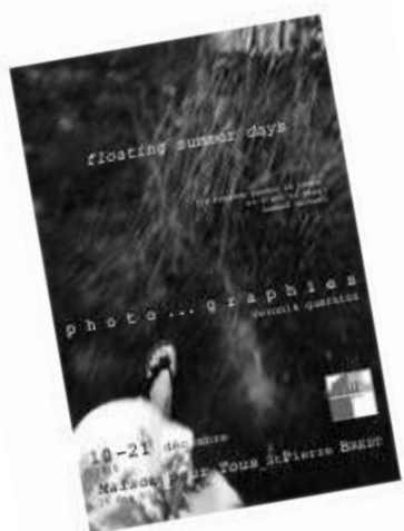
Décembre 2018 : Exposition photos et textes de Véronik Guernion Floating Summer Days :