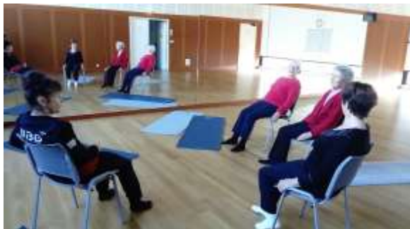
Gym pour les 70 ans et +