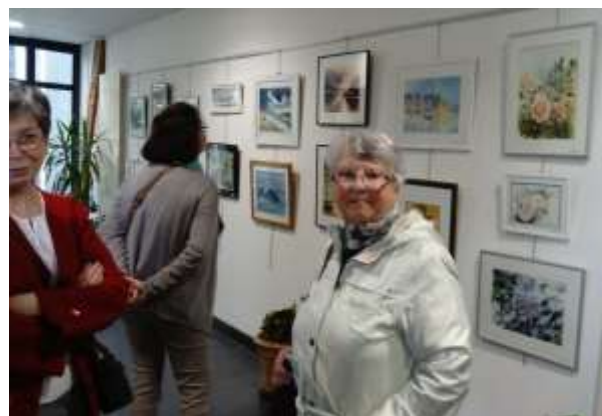
Vernissage le 24 mai 2019

Cet atelier autonome, composé de 16 membres, se retrouve tous les jeudis matins au sein de la MPT. Le fruit de leur travail a été visible à la MPT du 23 mai au 20 juin 2019. Bravo aux artistes !