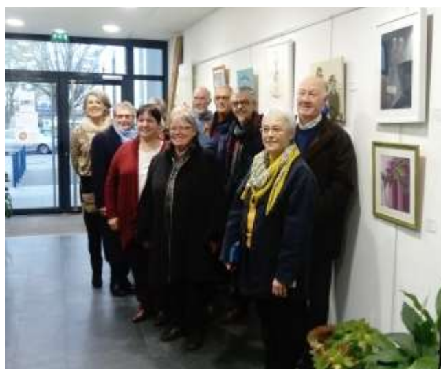
Mars 2019 : Peinture Plaisir en Liberté

« Donner à voir les réalisations de ses adhérents afin de les valoriser. » Extrait du Projet Associatif