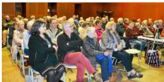
Le 10 novembre 2018

« Permettre à tous, notamment aux habitants du quartier, d'investir la MPT » Extrait du Projet Associatif