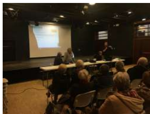
Le 29 Janvier 2019