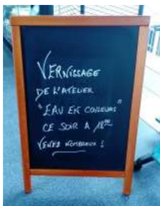
Le nouveau tableau indicateur

Nous poursuivons nos efforts en matière de communication même si cette année la démission subite de notre service civique a freiné cet élan.