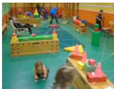
Veillée famille Halloween