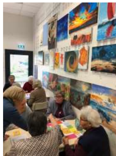
Club des Aînés

« Proposer des activités adaptées à différents niveaux de pratique, depuis l'initiation jusqu'au perfectionnement. » Extrait du Projet Associatif