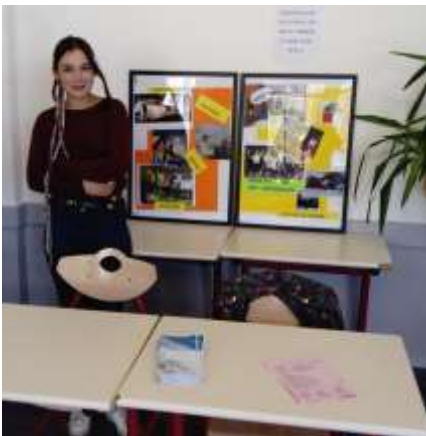
Collège la Fontaine Margot

« La communication vecteur d'ouverture et de rayonnement » Extrait du Projet Associatif