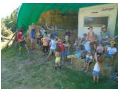
Sortie à la Ferme de Gwen

« L'ALSH place l'enfant au cœur de son projet éducatif avec comme objectifs de : - Permettre à l'enfant de grandir dans un environnement respectueux de sa personne. - L'accompagner dans son apprentissage de la vie en collectivité. - Faire de l'Accueil de Loisirs un lieu rassurant de découvertes. - Favoriser une relation de confiance avec les familles. » Extrait du Projet Associatif