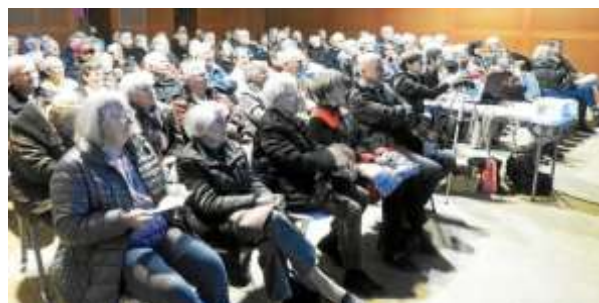
Le 16 mars 2019

Conférence gratuite « séniors consommateurs : ayez les bons réflexes » en partenariat la CLCV et le CLIC .